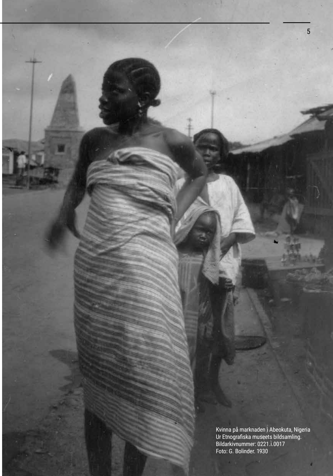
Kvinna på marknaden i Abeokuta, Nigeria Ur Etnografiska museets bildsamling. Bildarkivnummer: 0221.i.0017 Foto: G. Bolinder. 1930

Som inspiration för arbetet fick projektgruppens deltagare 2017 möjlighet att göra en studieresa till National Museum of African American History and Culture i Washington. Resan gav en inspirerande och viktig gemensam utgångspunkt för det fortsatta arbetet. I synnerhet var det värdefullt att en större grupp med olika professionsroller kunde dela upplevelsen. Kolleger i projektgruppen har senare haft förmånen att delta i en kollegial workshop på nederländska Nationaal Museum van Wereldculturen (NMVW) inför deras, besläktade, arbete med en omdaning av Afrika Museum i Berg en Dal. Sådana utblickar har bekräftat att projektet Afrika pågår ligger i tiden. Världskulturmuseerna är inte ensamma om att, med den samtida museologin i ryggen, försöka närma sig frågor om dekolonisering och nya tolkningstraditioner.