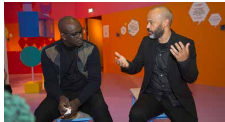
Övre bild Bild från interiören till Afrika Pågår.