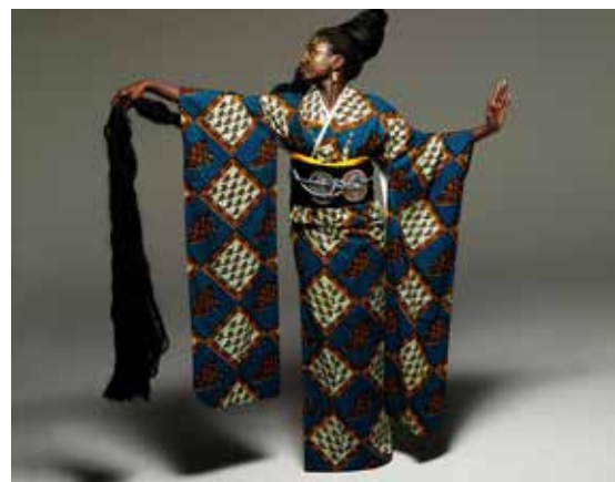
Verket är designat av kamerunfödde Serge Mouangue och sammansatt av den anrika japanska kimotillverkaren Odasho i Kyoto. Kimonon kombinerar västafrikanskt vaxtyg i bomull med siden från Kyoto i en kimono av furisode -typ och ingår i WAfrica. Bildarkivnummer: 905144

Världskulturmuseerna har vidare lånat ut föremål som på det sättet kunnat visas i andra sammanhang. Ett huvudstöd från Kongo ställdes ut i Cecilia Germains utställning The Dream Keeper, kurerad av Temi Odumosu på Botkyrka konsthall sommaren 2021.