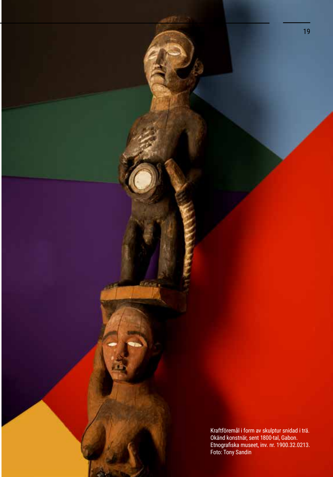
Kraftföremål i form av skulptur snidad i trä. Okänd konstnär, sent 1800-tal, Gabon. Etnografiska museet, inv. nr. 1900.32.0213.

Som stöd i det fortsatta arbetet har projektet utarbetat tool-kit 2, Möte med samlingarna (se bilaga B).