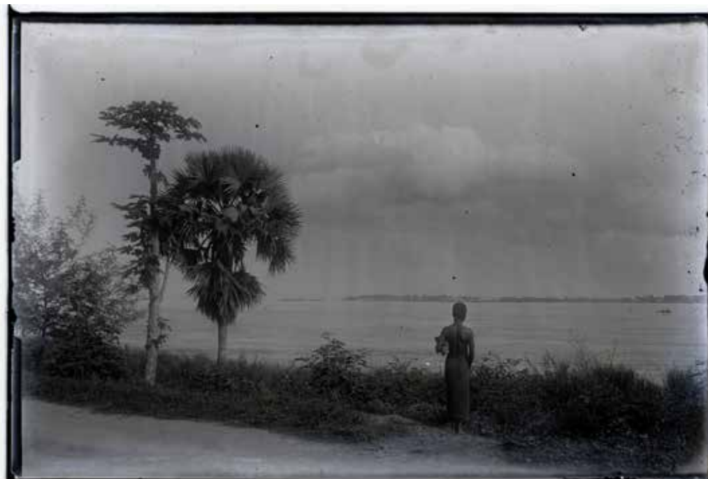
Kongofloden 1922 Bildarkivnummer: 0964.0317

Utvecklingsarbete pågår, alltså, och det kommer det att göra under överskådlig tid. För ju mer vi lär oss, desto fler intressanta frågor kan vi ställa. Allt hänger ihop och det tar aldrig slut.