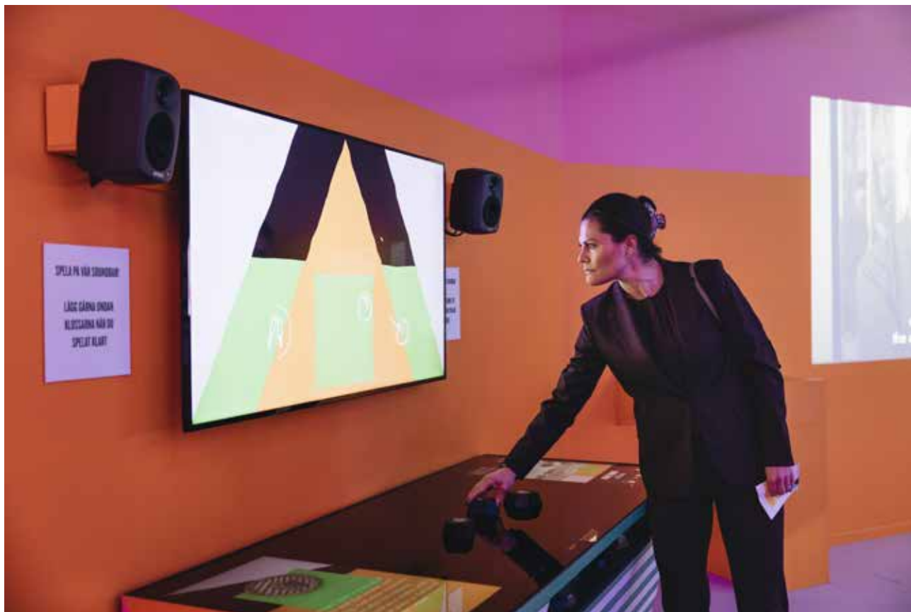
Kronprinsessan Victoria besöker Etnografiska museet och provar Sample Bar.