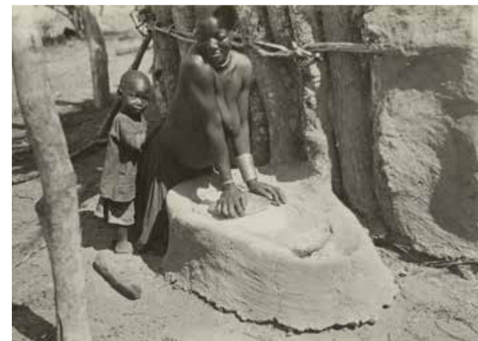
Foto på kvinna med barn som maler mjöl i södra Zambia, ca 1927-31. Vid en WHMZ workshop 2021 på landsbygden i södra Zambia berättade deltagare att malstenen (iziyo) är central för tonga-kvinnors identitet och inte endast ett materiellt objekt. Den placeras på en kvinnas grav efter hennes död.