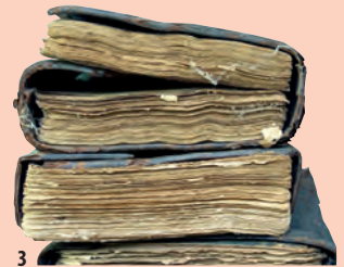
3. Läderbundna pappersböcker, Timbuktu, 1200 – 1600-tal e.v.t., 22 x 18 cm.