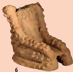
6. Terrakottastatyett täckt med knottor, Djenné-Djeno (Nigerflodens dal), 1200-tal e.v.t., 17 cm.