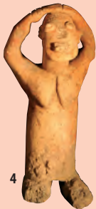
4. Terrakottastatyett, Djenné (Nigerflodens dal), 1100 – 1400-tal e.v.t., 37 cm.

1100 – 1500-tal e.v.t.: Antropomorf, kan ha mandelformade ögon, skurna ögonfransar, ögonlock med koncentriska inristningar, långsträckt näsa och hals. Figuriner med långa, slanka kroppar, antingen sittande eller stående. Kropparna kan vara släta eller täckta med runda knottor eller ormmotiv. Mått: 10-60 x 10-40 cm. [6–7–8]