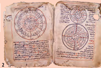
2. Manuskript av pergament, Timbuktu, 1200 – 1600-tal e.v.t., 26,5 x 41 cm.