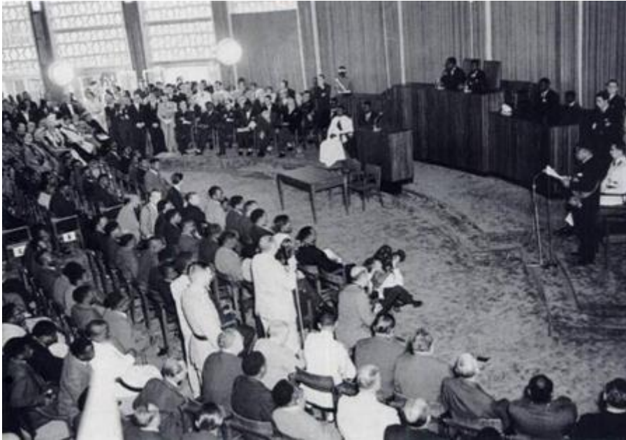
Belgien lämnar Kongo. Här är med självständighetsceremonin i Léopoldville 30 juni 1960.

Det dröjde bara några dagar innan Kongokrisen var ett faktum. Delar av armén gjorde myteri, våldsamheter bröt ut på flera håll och belgare började fly. Den belgiska kolonialismen ersattes av nykolonialism när provinsen Katanga, under ledning av Moïse Tshombe, bröts loss för att skydda de belgiska kopparbolagen.