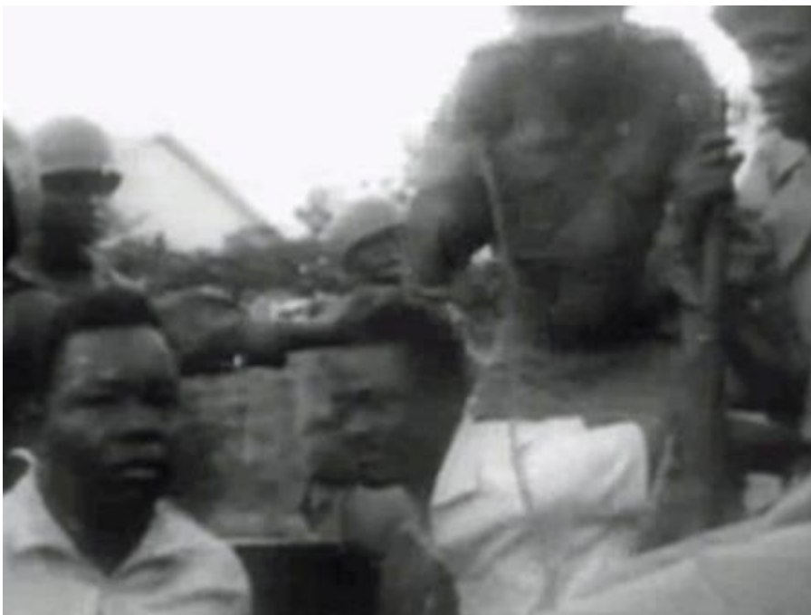
Patrice Lumumba grips i december 1960.

FN:s generalsekreterare, svensken Dag Hammarskjöld, försökte balansera mellan stormakternas intressen. Han dog den 18 september 1961 under inflygning till Ndola i Nordrhodesia (nuvarande Zambia) inför ett hemligt möte med Tshombe. Omständigheterna kring flygkraschen har aldrig klarlagts och nu, 56 år senare, pågår en ny utredning i FN där uppgifterna om att planet sköts ned utreds.