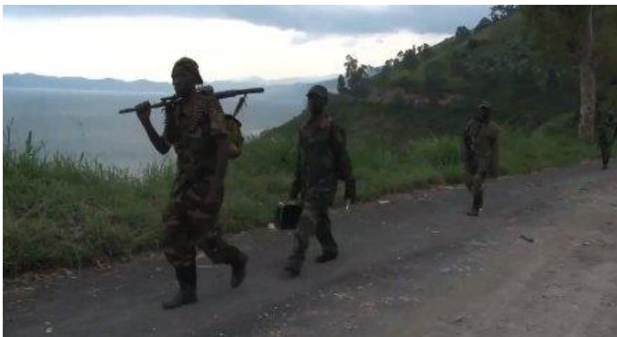
I slutet av 2012 lyckades rebellgruppen M23 överraskande inta miljonstaden Goma i östra Kongo. Här är M23-soldater när de lämnar staden.

Freden har dock inte kommit till Kongo. I de östra delarna har otaliga rebellgrupper, däribland FDLR, arvtagarerna till hutu-extremisterna 1994, fortsatt sin verksamhet. Massakrer fortsätter att drabba bybor trots att världens största FN-styrka, Monusco , finns på plats med cirka 22 000 soldater civila och poliser. Läget är fortsatt instabilt och den 28 september skickade FN-förstärkningar till Uvira efter rapporter om nya strider.