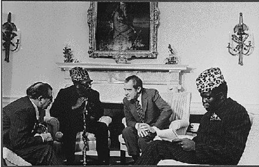
Joseph Mobutu besöker USA:s president Richard Nixon 1973.

År 1964 gav Tshombe upp och Katanga blev åter en del av Kongo. Som motprestation utnämnde president Kasavubu Tshombe till premiärminister. Ett år senare tog Joseph Mobutu makten i en kupp och styrde sedan fram till 1997. Tshombe flydde till Francos Spanien men hamnade i husarrest i Algeriet 1967, där han avled 1969, sedan hans flygplan hade kapats.