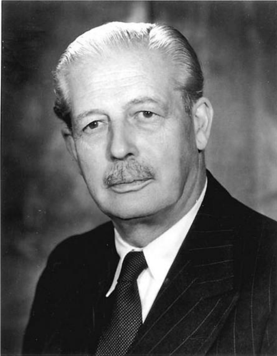
Harold MacMillan höll tal i Kapstaden om "förändringens vind" i Afrika.

År 1908 övertog den belgiska staten Kongo och efter Tysklands nederlag i första världskriget delade segrarmakterna upp de tyska kolonierna i världen. Belgien tilldelades då också Rwanda och Burundi. Belgiens kolonialpolitik innehöll inga planer på självständighet och så sent som 1955 var den officiella politiken att Kongo under en 30-årsperiod skulle få ökat självstyre. Politiken inriktades på att utvinna naturresurserna och belgiska plantageägare och gruvbolag hade ljusa tider.