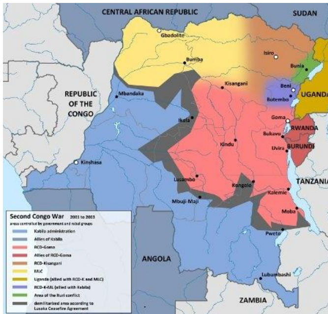
Delat land. Kongo 2001 då rebellgrupper och utländska arméer delade landet.

Sommaren 1998 kom nästa fas i det kongolesiska dramat. Kabila beordrade Rwandas och Ugandas arméer att lämna landet. Rwanda misslyckades att ta kontroll över Kinshasa och Kabila begärde militärt stöd från Namibia, Zimbabwe och Angola. De kommande åren skulle nio afrikanska länder vara involverade i det som brukar kallas "Afrikas världskrig". Ett 20-tal rebellgrupper, många av dem skapade av Rwanda och Uganda för att ge legitimitet åt inblandningen, var aktiva och när Rwanda och Uganda blev oense utkämpade deras arméer reguljära slag inne i Kongo. En viktig drivkraft i kriget var kontrollen över Kongos rika naturtillgångar.