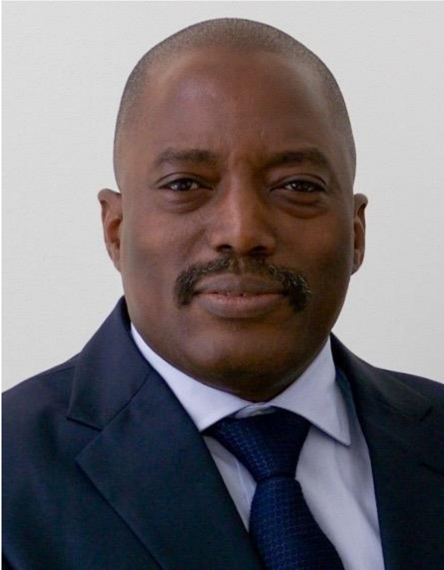
Joseph Kabila har suttit som president sedan år 2001.