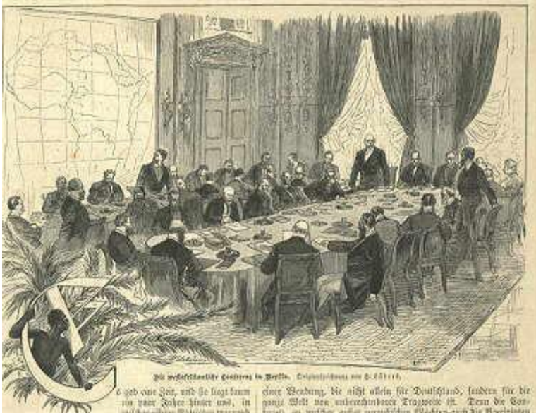
Afrika delas upp i Berlin.

Bakgrunden till dagens konflikter kan sökas tillbaka till 1800-talet. När dåtidens europeiska stormakter samlades till konferens i Berlin 1884-1885 delades Afrika upp, ibland med karta och linjal. Den belgiske kungen Leopold II:s krav på Kongobäckenet erkändes och 1885 utropades fristaten Kongo ledd av kungen själv. Hans personliga fristat expanderade och lade under sig delar som idag utgör Demokratiska republiken Kongo. Massmord och fruktansvärda övergrepp på befolkningen skapade en världsomfattande proteströrelse mot Leopolds vanstyre.