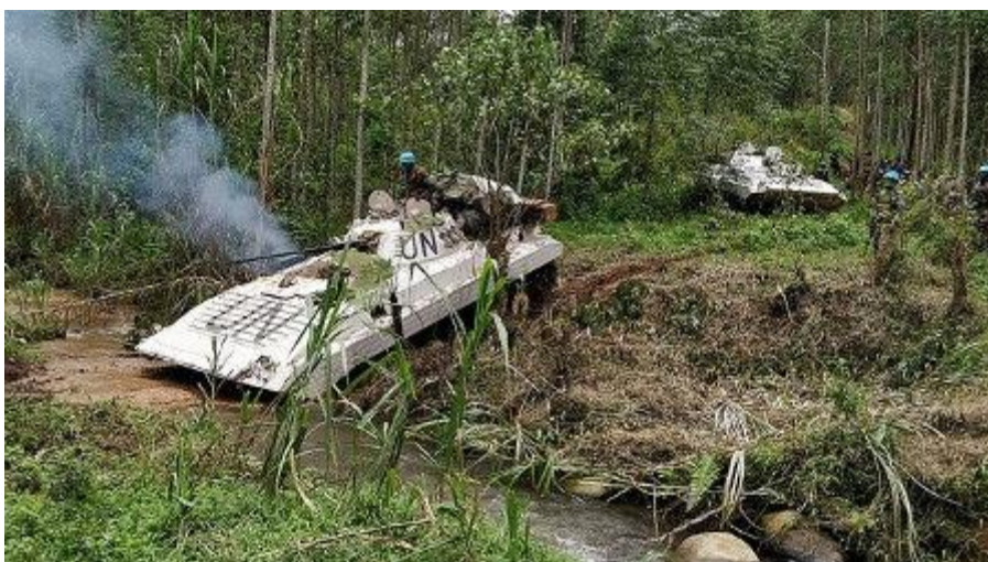
Monusco-soldater på patrull i Norra Kivu-provinsen i april 2018.